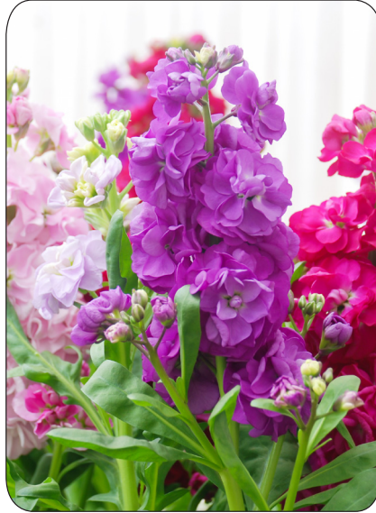
Sommerlevkøj Matthiola incana