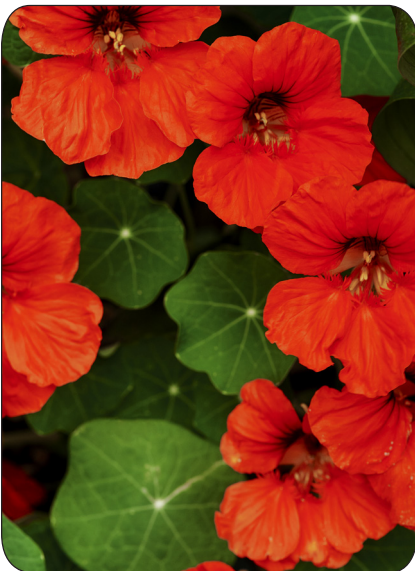
Tallerkensmækker, Rød Tropaeolum majus